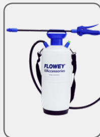
50054-10C Sprayer 10l