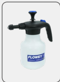
61016 Jet foamer 1,5l